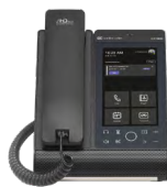
C470HD IP フォン