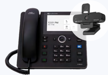
C455HD + RXVCam10