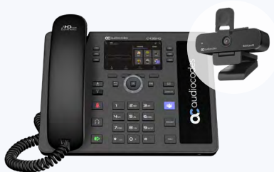
C435HD + RXVCam10

ビデオ通話が当たり前になってきた今日、これらのIP電話機にビデオカメラ「 RXVCam10 」を追加することをお勧めします（お得なバンドルパッケージもあります）。