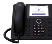
C448HD IP Phone