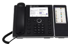
C450HD IP Phone with Expansion Module