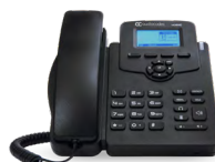
445HD IP フォン