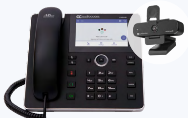
C450HD + RXVCam10