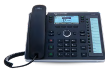
440HD IP フォン