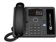
C435HD IP Phone